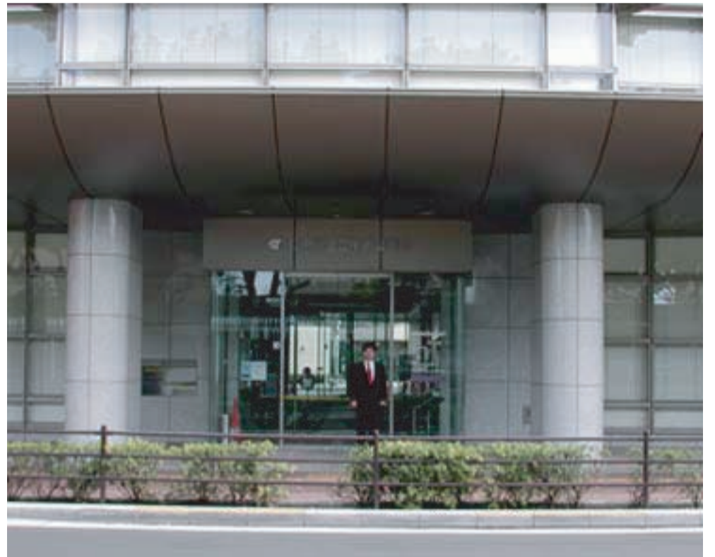
これは休館日だった月曜日の朝、中央図書館前で写した記念写真です。今後、このように月曜日休館ということが原則無くなります。